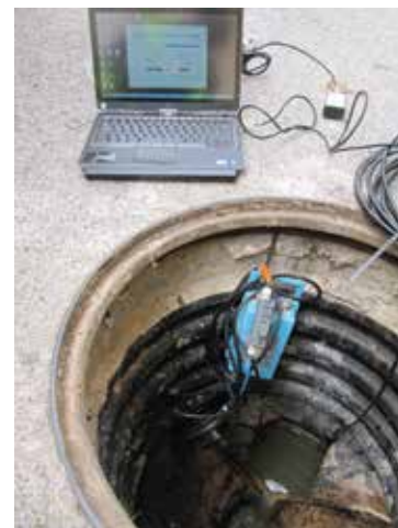
Appareils de mesure des investigations complémentaires sur le réseau d'eaux usées