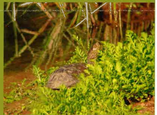
Cistude d'Europe, tortue aquatique patrimoniale