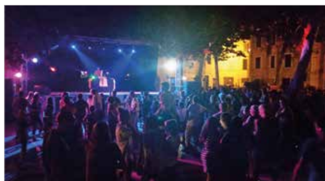
Fête locale du 22 août 2015 : Soirée White's DJ Night