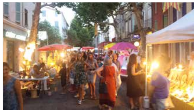
Marché nocturne du 17 juillet 2015