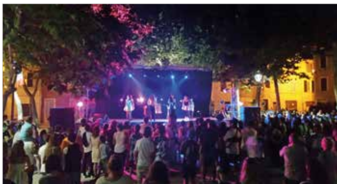
Fête nationale du 13 juillet 2015