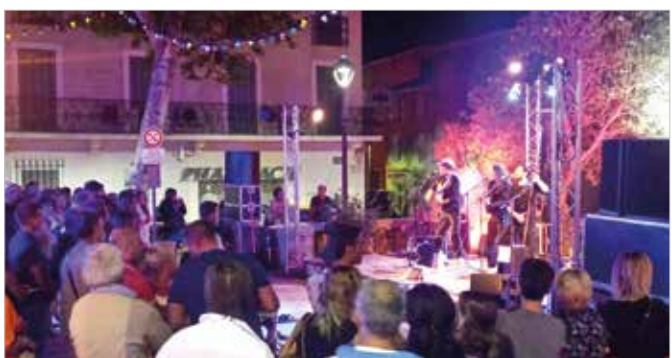
Fête locale du 21 août 2015 : Soirée acoustique pop