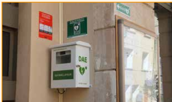
Santé : Mise à disposition du public de 2 défibrillateurs devant la mairie et dans la salle Jean Latour

Montant des dépenses réelles d'investissement en 2015 :