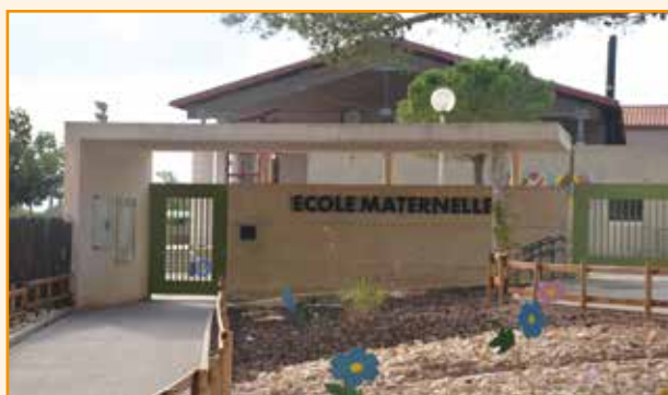
Enfance : Mise en place des Nouvelles Activités Périscolaires (NAP), acquisition de divers matériels et mobiliers (jeux pour la cour, bureaux, ordinateurs, tableaux...)