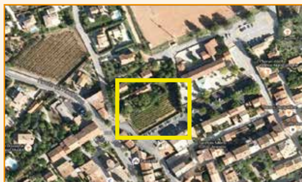
Enfance : Acquisition d'un terrain jouxtant l'école élémentaire pour le projet d'extension du groupe scolaire (cofinancé par le Conseil départemental et le Conseil Régional)