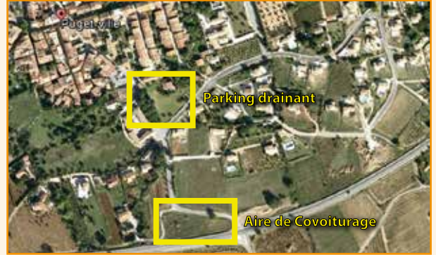
Stationnement : Acquisitions de 2 parcelles pour une aire de covoiturage et un parking drainant