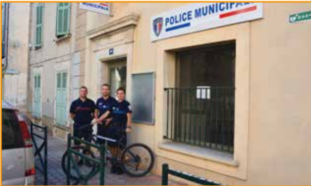
Sécurité / Police municipale : nouveaux locaux, procès-verbaux électronique, brigade VTT, équipe renforcée avec le recrutement d'un 3 ème agent