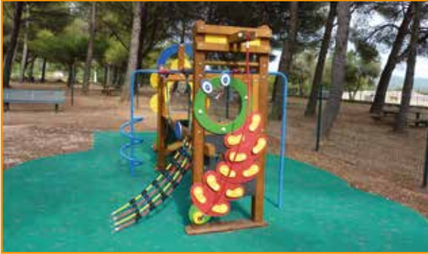
Aires de jeux : réfection de l'aire de jeu Firmin Eustache et acquisition de jeux pour l'école maternelle