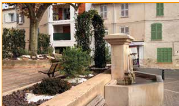
Espaces Verts : Création d'espaces verts sur la place de la Liberté et fleurissement de la rue de la Libération