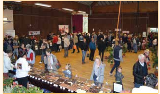
Événementiel : une programmation éclectique (salon du chocolat, salon du bois et du vin, salon du bien-être et de la diététique, concerts à la médiathèque, fête locale...)