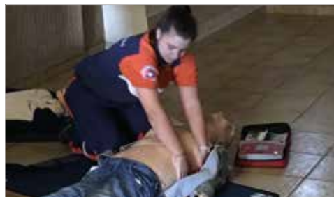
Salle des réunions - 19 avril 2016

Suite à l'acquisition de 2 défibrillateurs semi-automatiques et grâce au concours de la Protection Civile du Var , les commerçants de Puget-Ville ont pu suivre une formation d'initiation à l'utilisation de ces appareils. ■